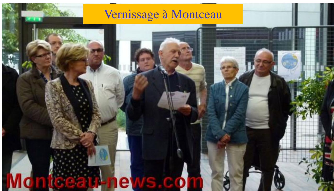
Vernissage à Montceau