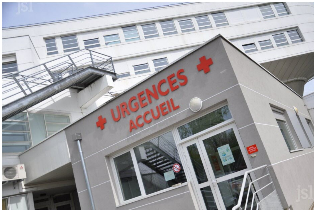
■ Le service d'urgences de l'hôpital de Montceau.