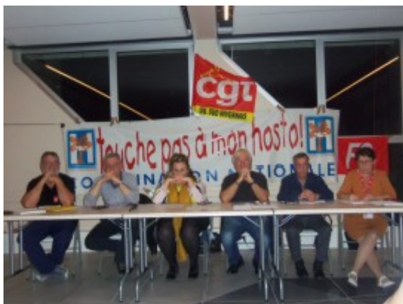
Photo du débat public du 4 Octobre